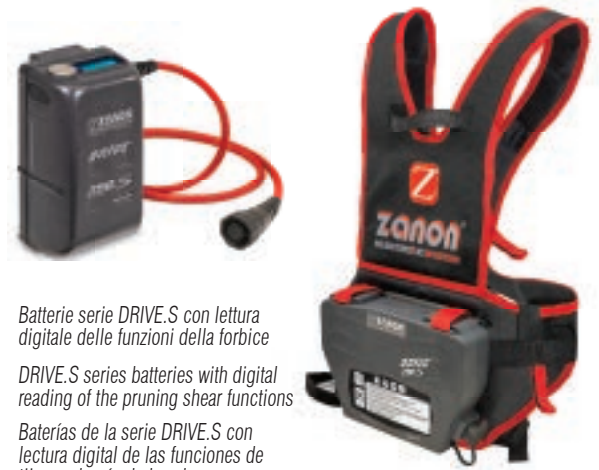
Batterie serie DRIVE.S con lettura digitale delle funzioni della forbice