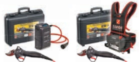
Kit DRIVE 350.S