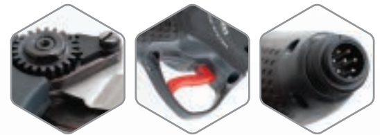
Baterías de la serie DRIVE.S con lectura digital de las funciones de tijera, además de las alarmas que puedan surgir, a través del display LCD